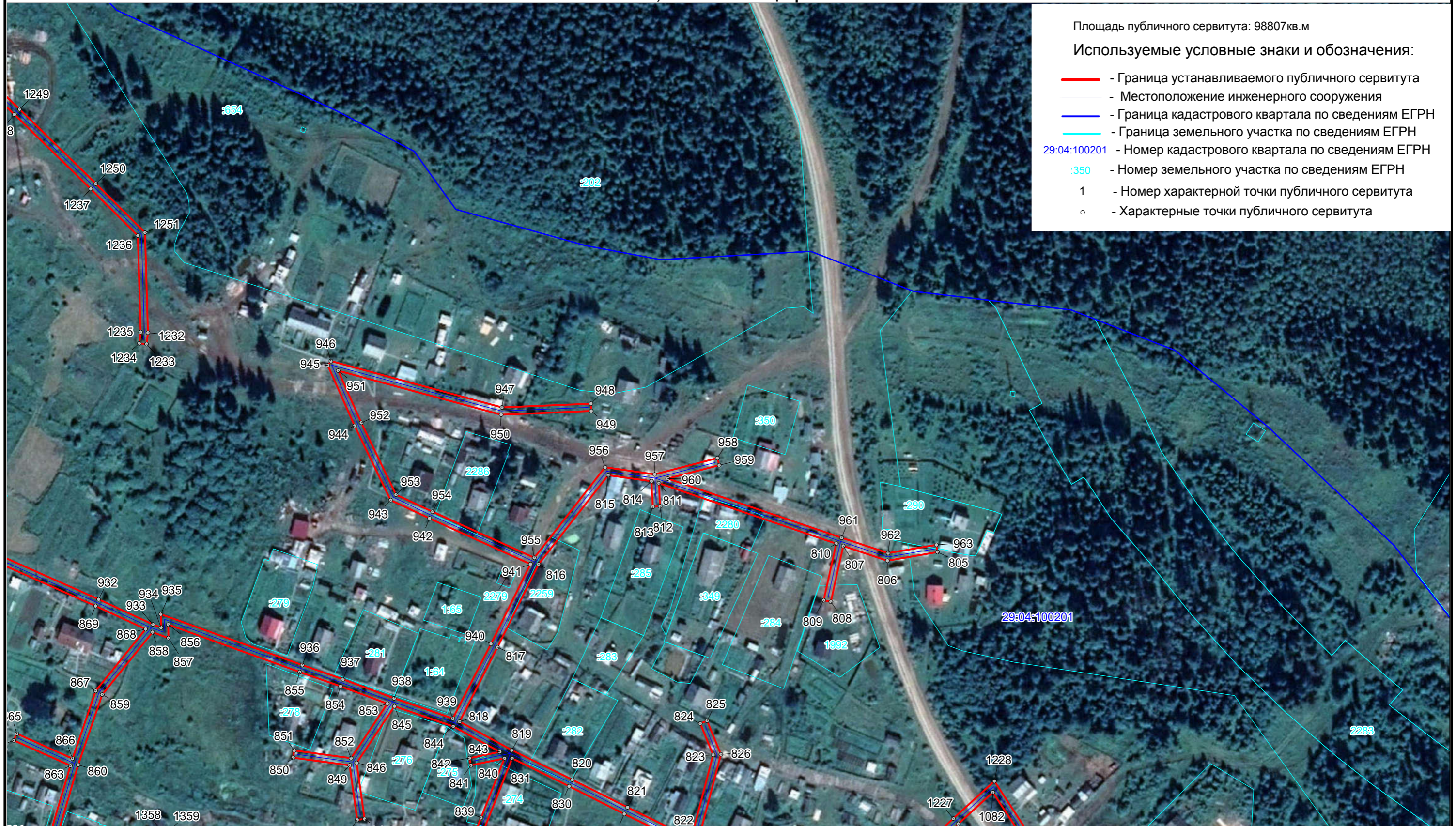
Схема расположения границ публичного сервитута ВЛ-0,4 кВ АО "Концгорский ЛПХ"