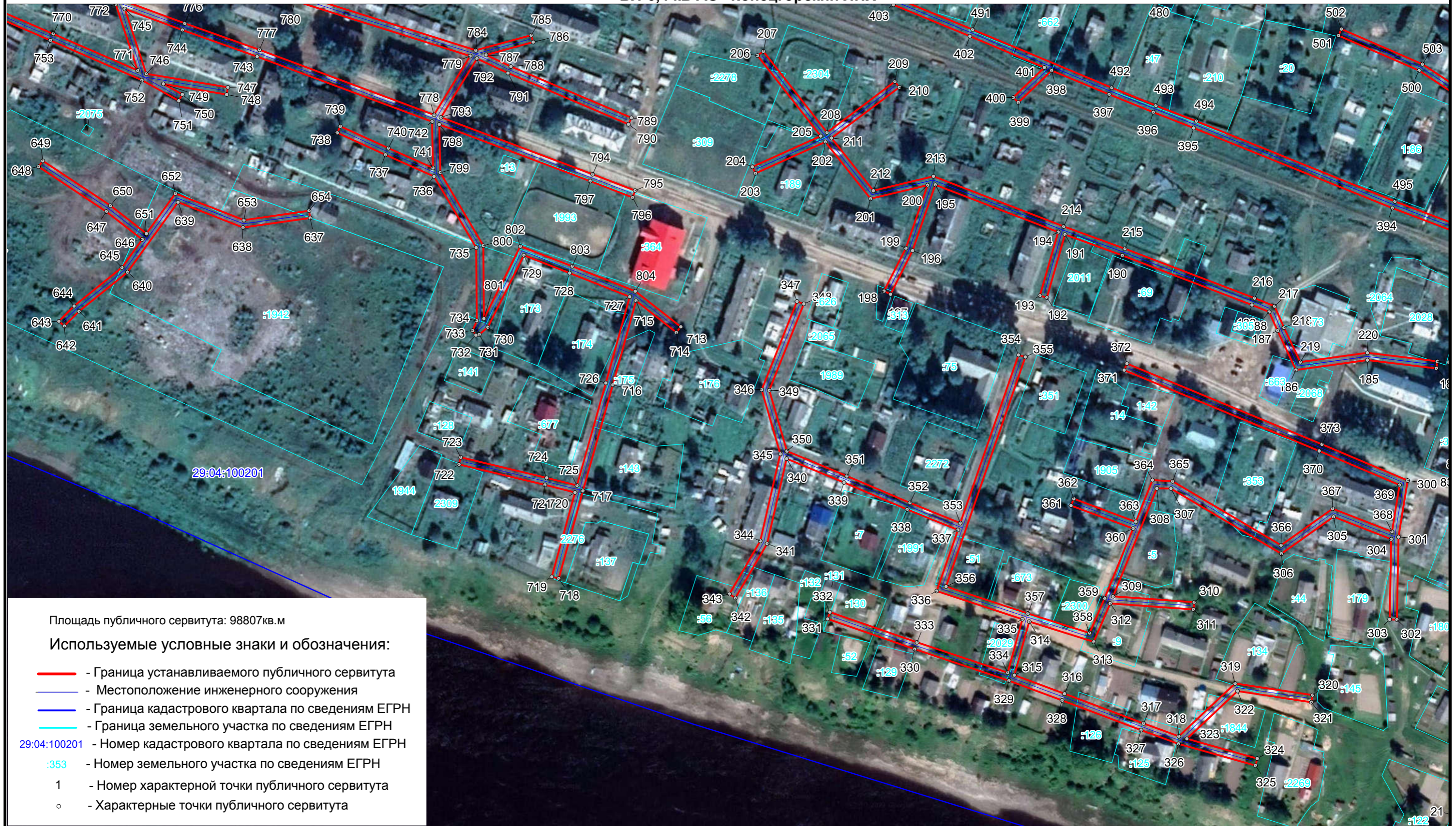
Схема расположения границ публичного сервитута ВЛ-0,4 кВ АО "Концевгорский ЛПХ"

Площадь публичного сервитута: 98807 кв. м