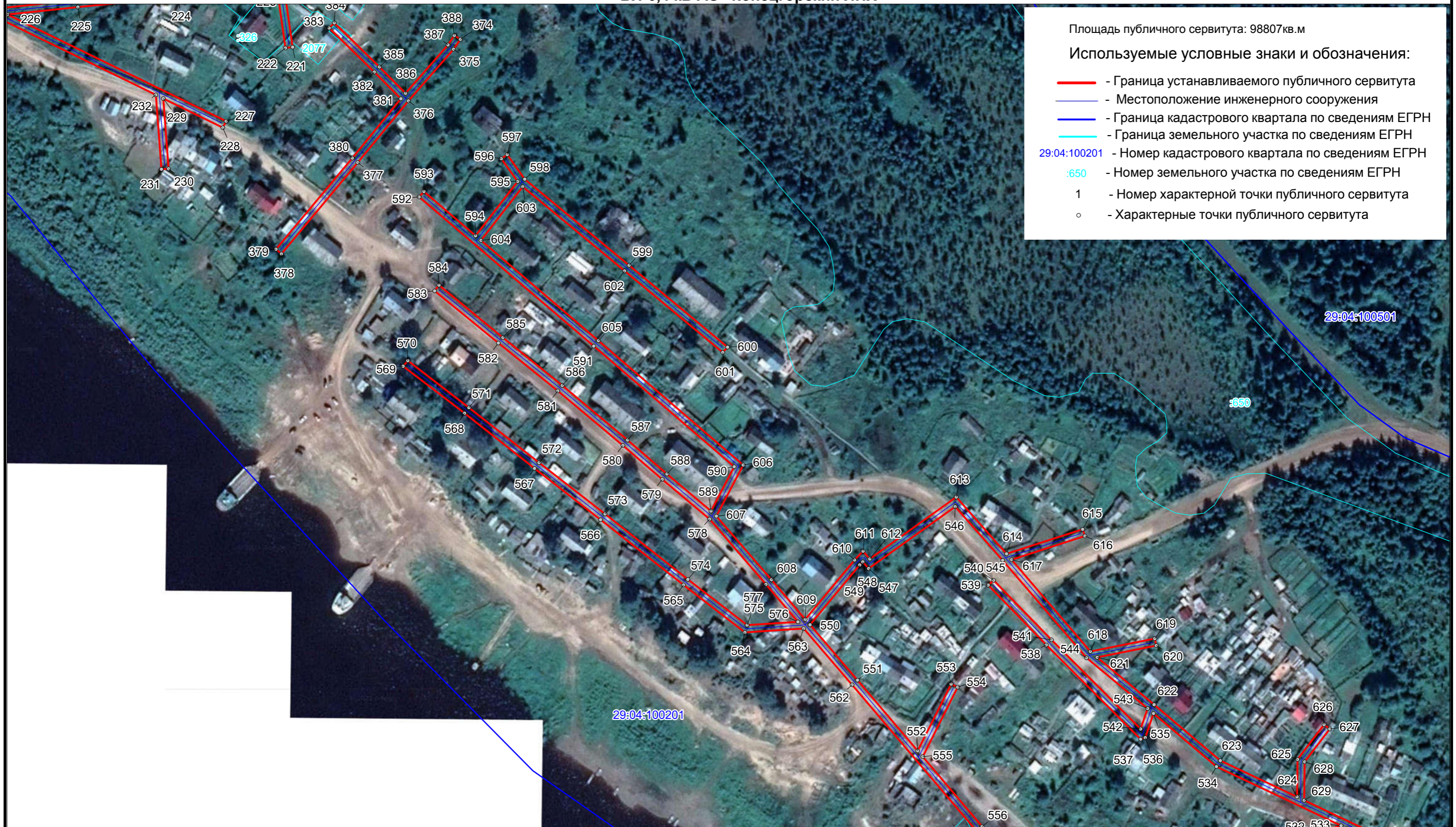
Схема расположения границ публичного сервитута ВЛ-0,4 кВ АО "Концевгорский ЛПХ"