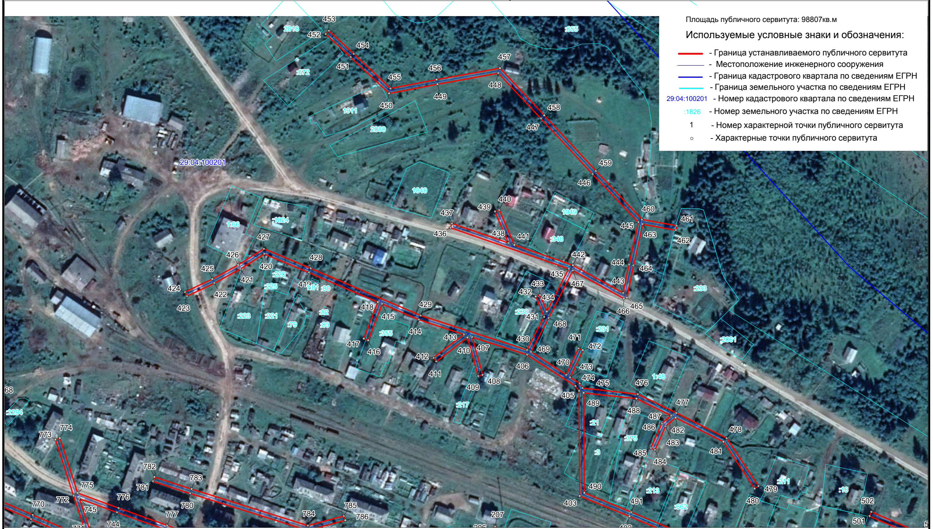
Схема расположения границ публичного сервитута ВЛ-0,4 кВ АО "Концгорский ЛПХ"