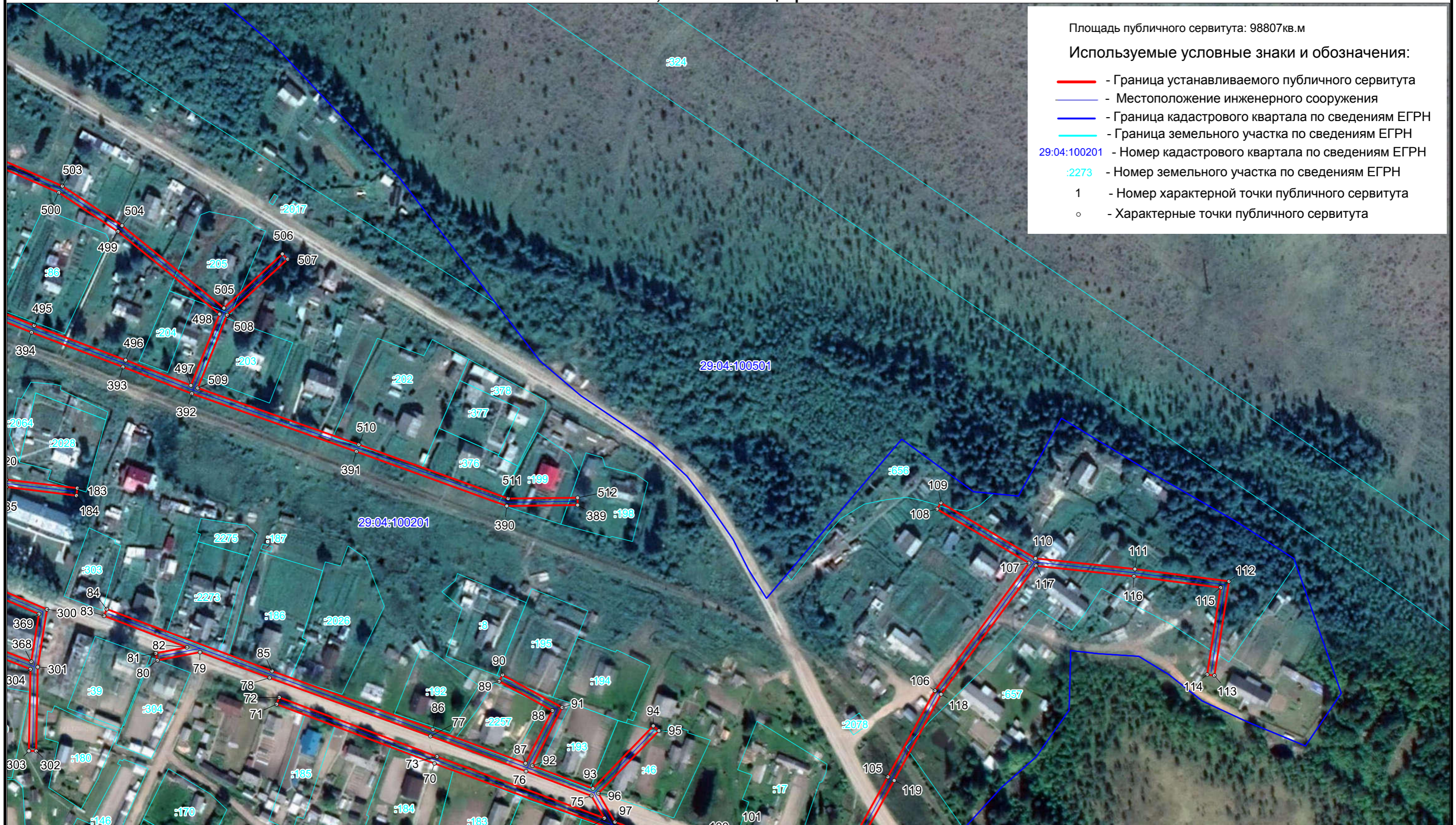
Схема расположения границ публичного сервитута ВЛ-0,4 кВ АО "Концевгорский ЛПХ"