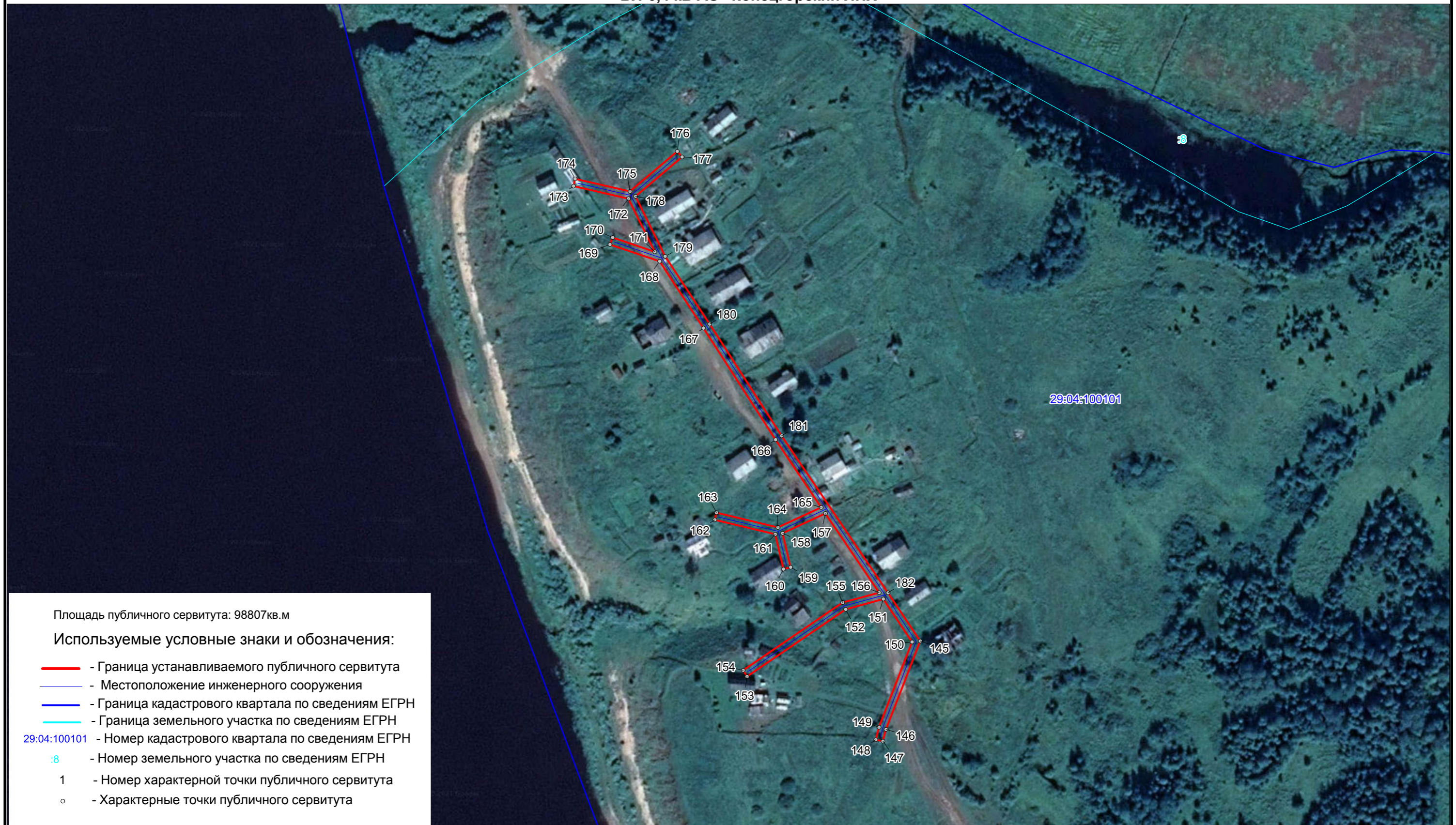
Схема расположения границ публичного сервитута ВЛ-0,4 кВ АО "Концгорский ЛПХ"