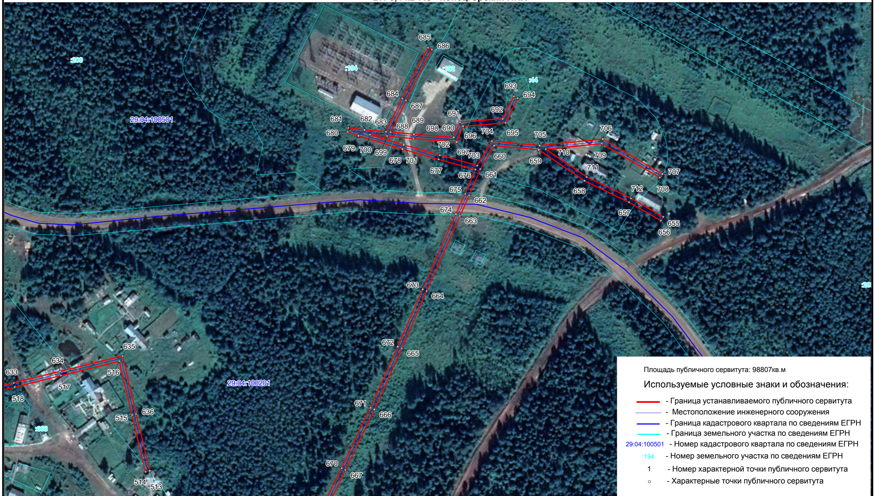
Схема расположения границ публичного сервитута ВЛ-0,4 кВ АО "Концгорский ЛПХ"